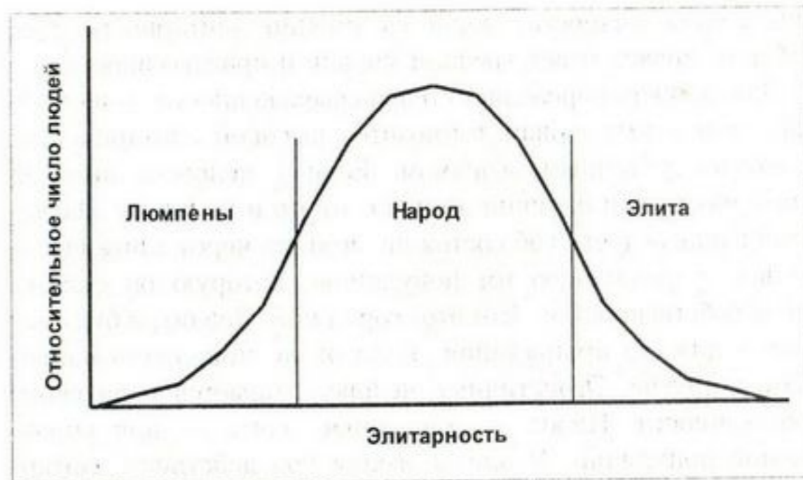
Рис. 2. Усреднённая зависимость между элитарностью и относительным числом людей в популяции. Вертикальные линии представляют собой условные границы между элитарными группами — классами.