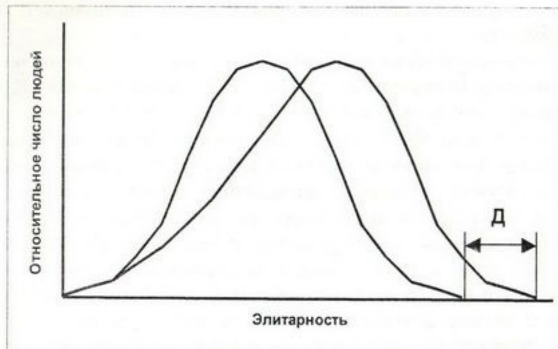
Рис. 1. Изменение распределения людей в популяции в зависимости от элитарности в филогенезе и естественный положительный дрейф элитарности (Д).

свои личные заслуги перед коллективом (стаей, общиной, родом, племенем). Высшие духовные свойства, ум, талант, воля, доброжелательность давали возможность отдельным людям быть избранными в элиту. С такими характеристиками они могли осуществлять многоходовые операции и прогнозировать их последствия.